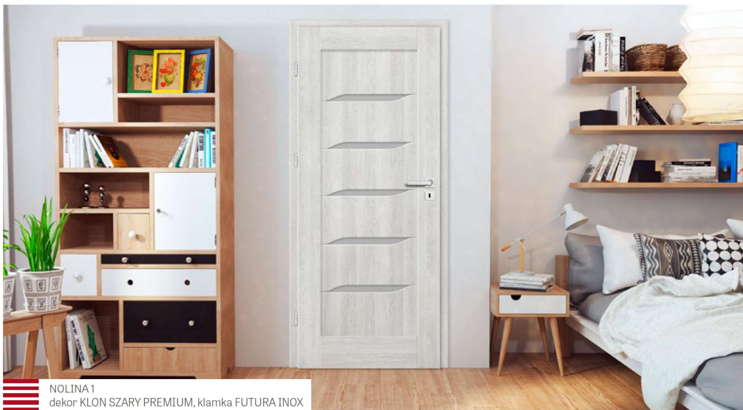
NOLINA 1 dekor KLON SZARY PREMIUM, klamka FUTURA INOX

SKRZYDŁA DRZWIOWE WEWNĄTRZLOKALOWE RAMIAKOWE STILE PRZYLGOWE I BEZPRZYLGOWE